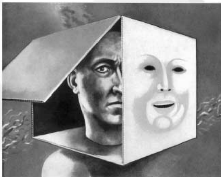
Wolfgang Mattheuer "Das zweite Gesicht"

Ich wusste von der Stasi. Jeder wusste von ihr. Doch erst nach dem Ende der DDR wurde mir klar, mit Welch menschenverachtenden Methoden Andersdenkende behandelt wurden.