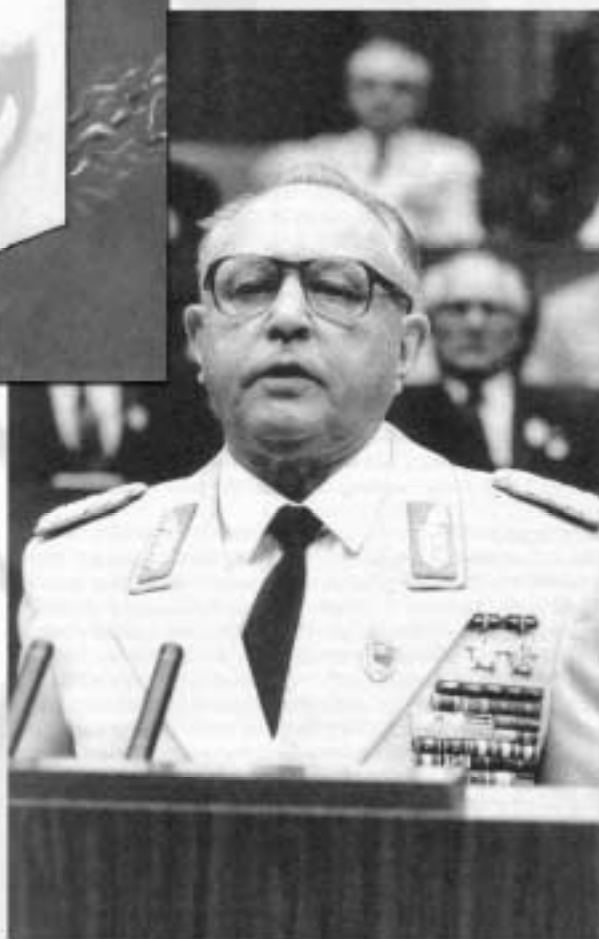
Erich Mielke, Chef der Staatssicherheit auf einem "Kampfmeeting" zum 35. Jahrestag der Bildung seines gefürchteten Ministeriums