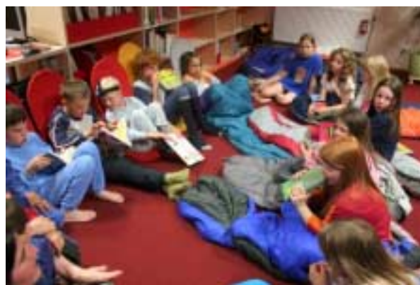
„Bücherrunde“ – Wie heißt dein Lieblingsbuch?

Anschließend begaben sich die Schüler auf literarische Schnitzeljagd. Als Preise gab es viele spannende Bücher zu gewinnen.