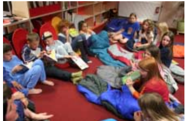
„Bücherrunde“ – Wie heißt dein Lieblingsbuch?

Anschließend begaben sich die Schüler auf literarische Schnitzeljagd. Als Preise gab es viele spannende Bücher zu gewinnen.