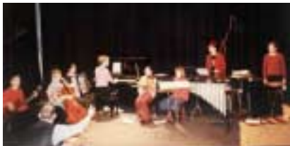
„Carl Orff“ Kammerorchester

Eintritt: frei – Spenden für unseren Flügel sind herzlich willkommen